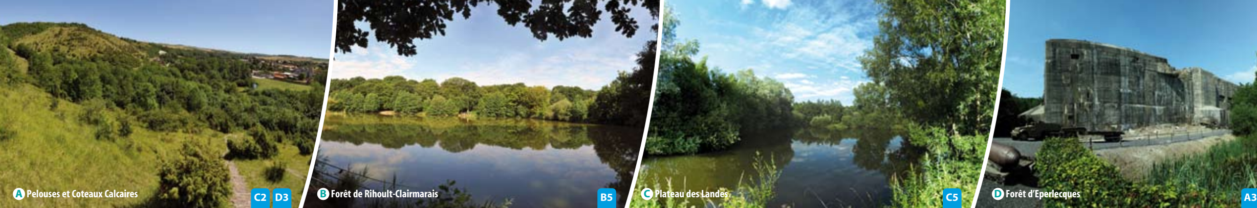
A Pelouses et Coteaux Calcaires

Walking - Cycling - Horseriding trails Wandel- Fiets- Ruiter-routes