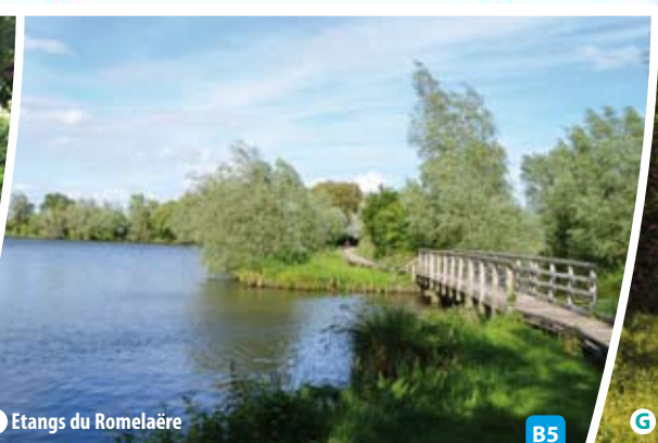
F Etangs du Romelaère