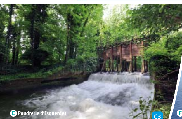
E Poudrière d'Esquerdes