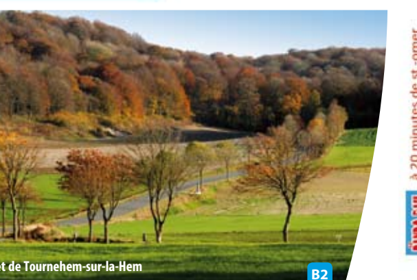
I Forêt de Tournehem-sur-la-Hem